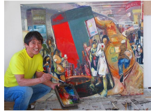
瓜生山 キャンパス 京都造形芸術大学