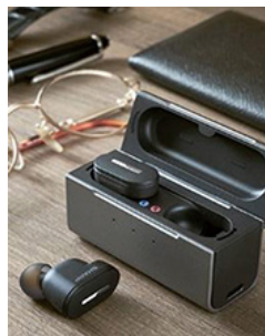
品名：シャープ・メディカル リスニングプラグ 品番：MH-L1-B

シャープは一般的な補聴器とも集音器ともちがう、あたらしいリスニングツールを作りました。