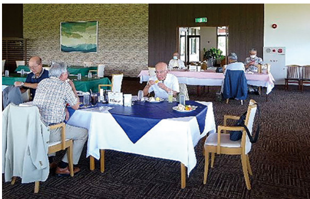
表彰式なしの会食風景

又、150回の記念大会では、個人の名前入りストラップを作成し全員に配布致しました。