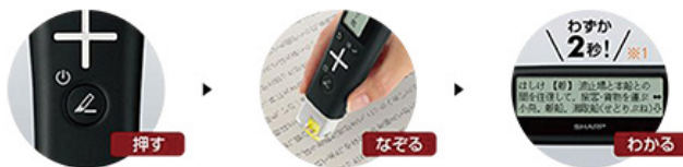
品名：シャープ・ペン型スキャナー辞書(英語モデル) 品番：BN-NZ2E

辞書を引っ張り出す必要がなく、知りたいときになぞるだけで意味が分かる快適さを手元にいかがですか。