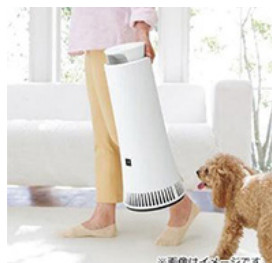
品名：シャープ・プラズマクラスター除菌脱臭機 品番：DY-S01

そもそも、脱臭機って何？空気清浄機と何が違うの？空気をキレイにするという目的は同じなのですが、空気清浄機がホコリや花粉、ニオイなど空気の汚れに総合的にアプローチするのに対し、脱臭機はニオイに特化したもの。