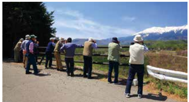
SS フォトクラブ 撮影旅行 御嶽山