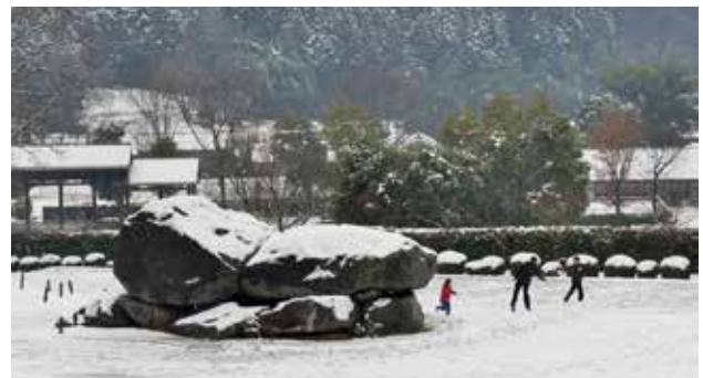
雪の石舞台上遊ぶ

これからも、続けられる限り、更なる技術の向上を目指します。また、オンリーワン撮影スポット探し・写真創りを楽しみます。芸術写真、記念写真、スナップなど、幅広く奥深い写真の世界を楽しむことで、健康的な老後生活にできればと思っています。