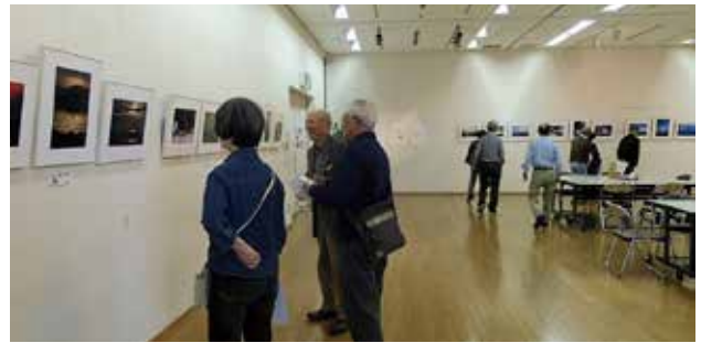
SS フォトクラブ 写真展風景