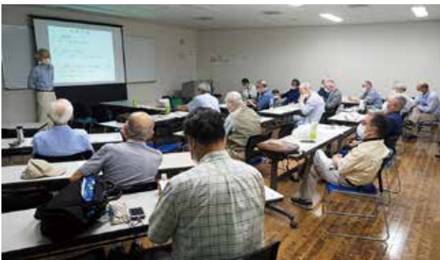
SS フォトクラブ 例会風景

多くの先生方のご指導を受け、他の方々のたくさんの写真を見、一緒に撮影しているうちに、良い写真を撮りたい気持ちが膨んだのです。