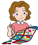
原田節子さん (No. 2161)