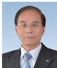
シャープ株式会社 会長兼社長 戴 正 呉