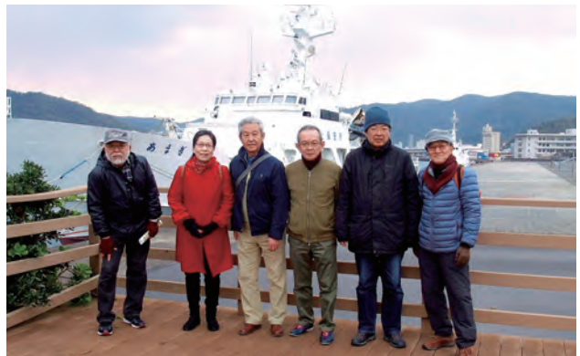
海上保安庁の船をバックに

皆さんと一緒に歩いていると、永らく会ってなかった方との出会いをはじめ、現役時代にはお付き合いの無かった方々とも、ちょこちょこ雑談しながら、街並みや風景を堪能し、心身共にリフレッシュする一日となっています。