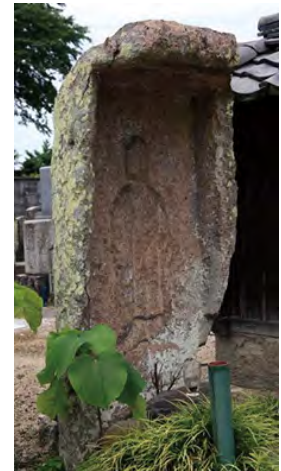
慶運寺境内の石棺仏

又、平成30年7月には「慶運寺境内の石棺仏」という演題で、出身地・熊本阿蘇のピンク石(馬門石)について桜井市慶運寺で講演、「奈良まほろばソムリエの会」の例会でも「阿蘇ピンク石と奈良桜井の古墳」の題目で講演しました。