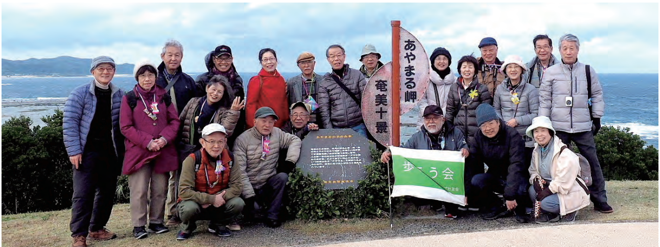
特別企画 奄美大島で記念撮影