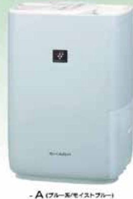
-A(ブルー系/モイストブルー)