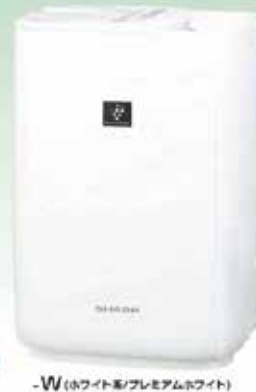
-W(ホワイト系/プレミアムホワイト)