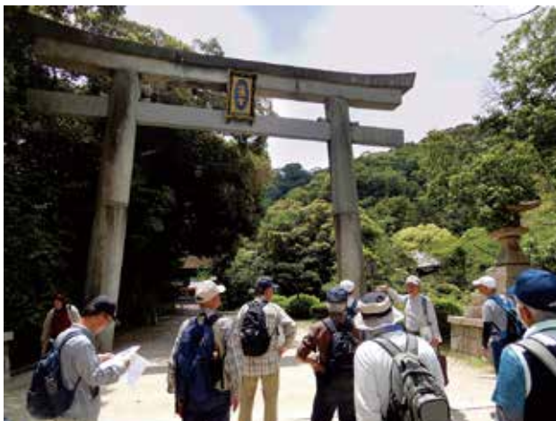
2019年5月 京都・石清水八幡宮にて

歴史の謎にほんのちょっと迫り、様々な想像を巡らせてミステリー小説の謎解きの様な事をするのも、歴史探訪の楽しさのひとつだと私は思っています。