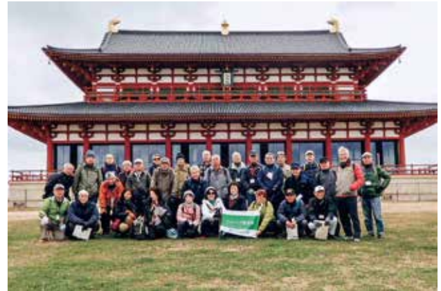
2020年1月 奈良・平城京宮跡にて

様々な時代の遺跡、寺社等を訪れ、そこで生活をしてきた人達に想いをはせると、歴史のロマンを感じます。