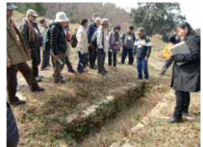
八尾おんじやま古墳にて(心合寺山古墳)

歴史に興味がある方も、そうでない方も、一緒に史跡を歩いて歴史のロマンを感じてみませんか。