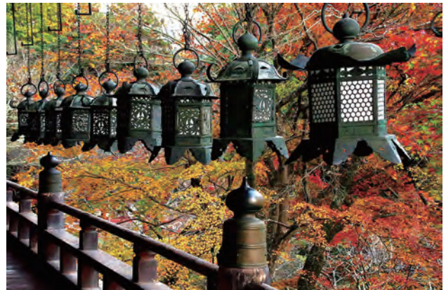
古刹彩秋 談山神社