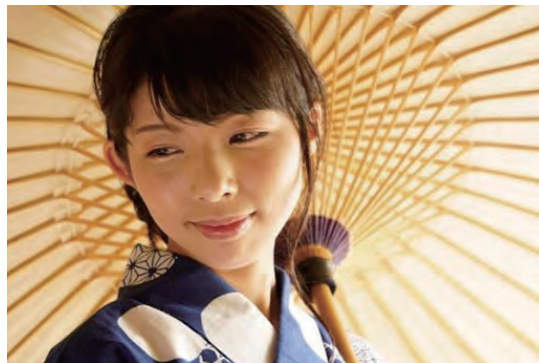
ソニーモデル撮影会