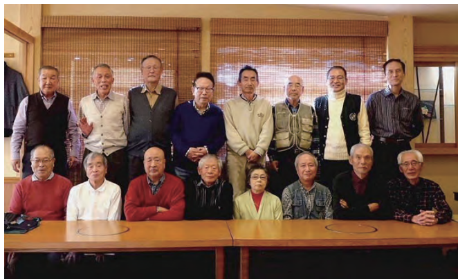
リビングOB会 淡路屋別館