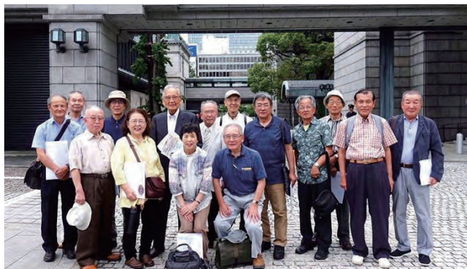
二水会 日銀大阪支店見学

又、リビングOB会は電化リビング事業推進部の定年退職者を中心に2002年2月に12名で第1回を開催し、以降2019年12月に第36回目迄を開催致しました。尚、現在の会員は25名です。