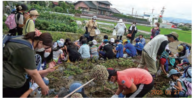
ジャガイモ収穫祭