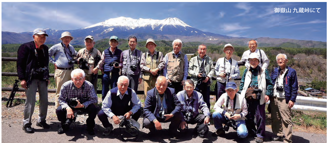
御嶽山 九蔵峠にて

いずれにしてもコロナは、必ず終息します。社友会の皆様、歳をとっても気楽に楽しめる当「SSフォトクラブ」への入会をお待ち致しております。