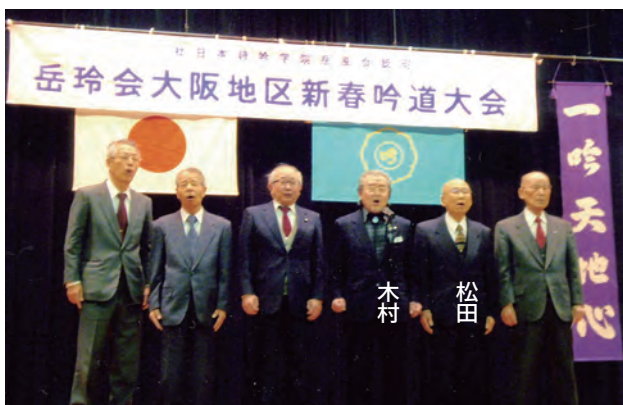
岳玲会 大阪地区 新春吟道大会

「氏名、会員番号、流派、吟歴、詩吟との出会い、同好会へ一言、他の同好会」等の順です。