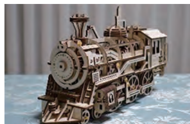
最近作:木製蒸気機関車

模型作りも小さい頃からの趣味の一つでした。定年退職後は多くの模型を作っています。主に部品がセットになったもの(例えば週刊誌のデアゴスティーニ社やアセット社の部品がセットになったもの)等を購入して組立てを楽しんでいます。