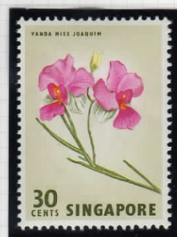
Vanda miss joaquim