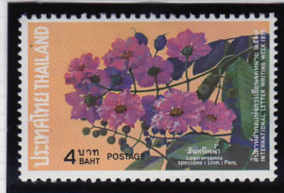
Lagerstroemia speciosa 大花百日紅(オオハナサルスペリ)

18940 สัปดาห์สากลแห่งการเขียนจดหมาย ๖ - ๑๒ ตุลาคม ๒๕๑๗