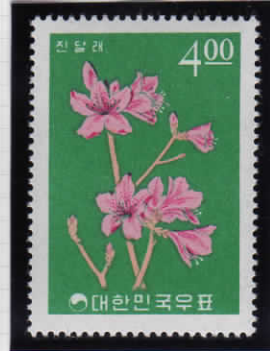
Azalea 躑躅 (ツツジ)