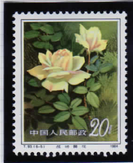
Yellow flower in battlefield 戦場の黄色い花