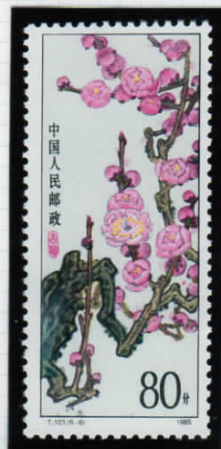
Apricot mei 黄赤色の梅