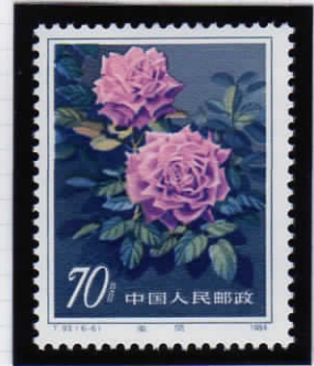
Blue Phoenix 青い鳳凰