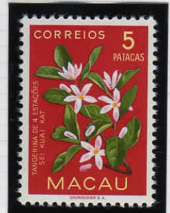
Tangerine blossoms オレンジの花