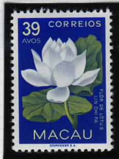
Lotus flower 蓮 = 国花