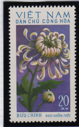
Ngoc khong tuoc