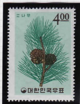
Pine branch and cones 松

国花である木槿(ムクゲ)は含まれていないが、さすがに 松・竹・梅 は含まれている。