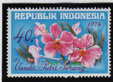
Vanda putri serang