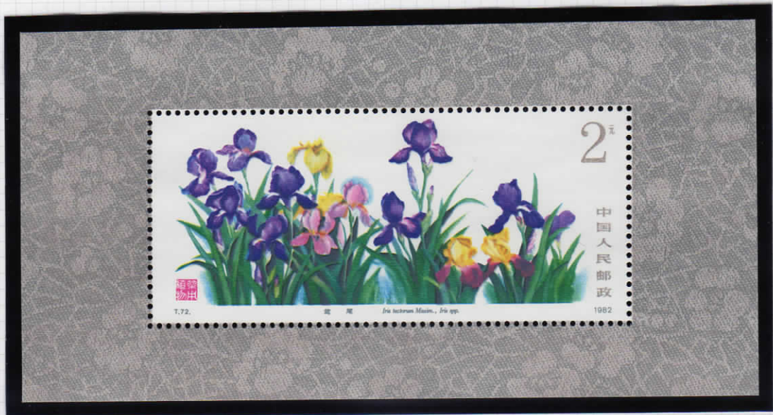
S/S Iris tectorum maxim 一初 (イチハツ) アヤメ科 アヤメ属