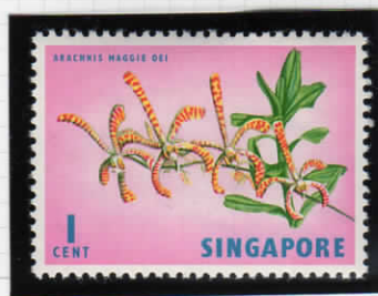
Arachnis Maggie oei