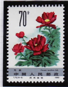
Paeonia lactiflora 芍薬 (シャクヤク)