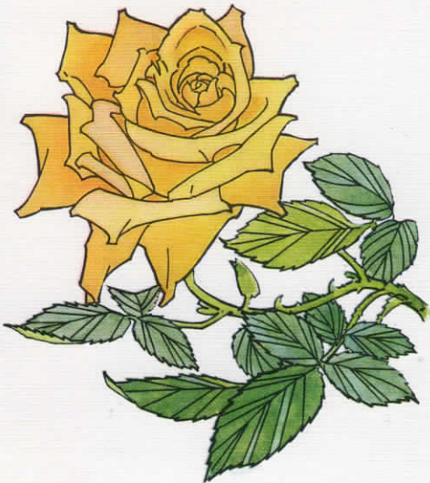
首日封 F. D. C.