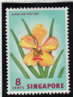
Vanda tan chay yan