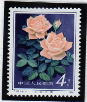
Spring of Shanghai 上海の春