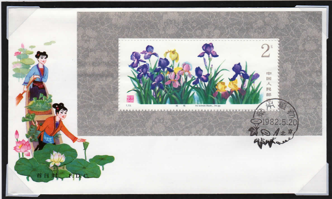
Medicinal Herbs 薬草 7 種中の 1 種 - FDC 1982.05.20 北京