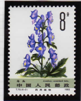
Aconitum carmichaeli トリカブト