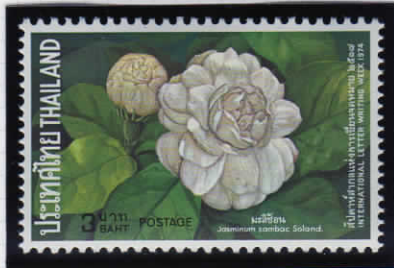
Jasminum sambac 茉莉花(マツリカ)