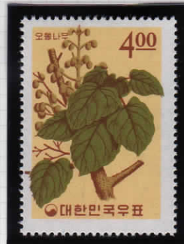
Paulownia coreana 桐