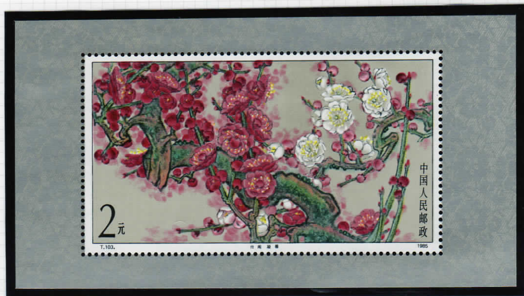
S/S Duplicate and condensed fragrance mei 芳香梅の縮小複製