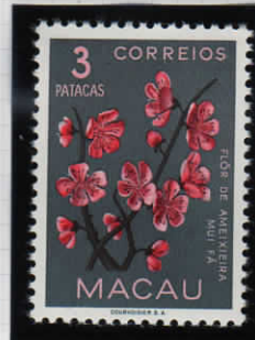
Cherry blossoms 桜の花