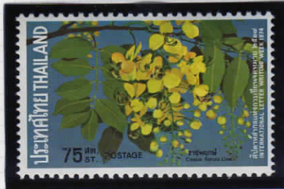
Purgina cassia ナンバンサイカチ = 国花

1974年に国際文通週間の記念として、4種の花の切手とその小型シートが発行された。