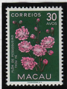
Peach flower 桃の花