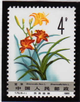
Hemerocallis flava ワスレグサ属