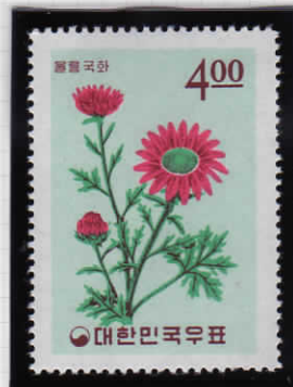
Chrysanthemum lucidum 菊