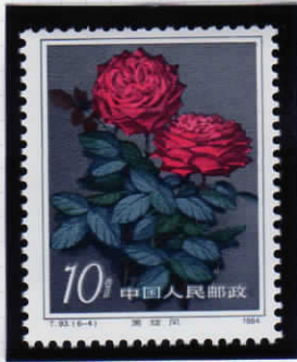
Black whirlwind 黒い旋風