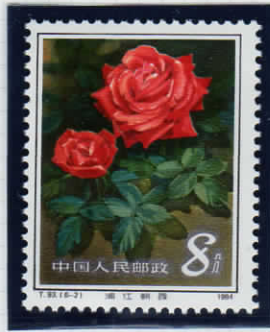
Rosy Dawn of Pujiang River