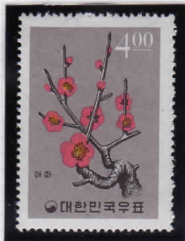
Plum blossoms 梅の花