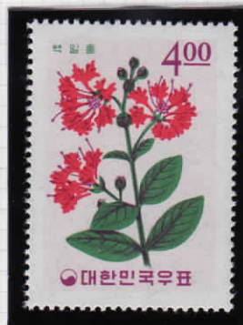
Crape myrtle キンバイカ