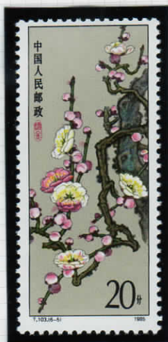
Versicolor mei 複色の梅