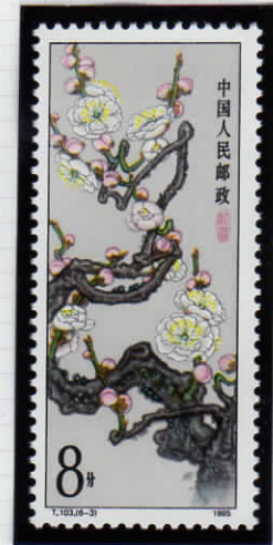
Contorted dragon ゆがんだ龍