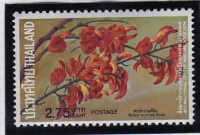
Butea superba ブテアスペルバ