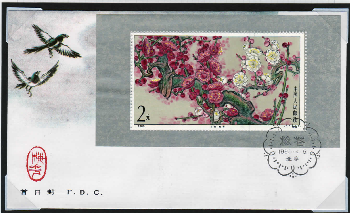
Mei (Prunus mume) 梅花 7 種中の 1 種 - FDC 1985.04.05 北京