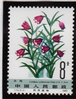
Fritillaria unibracteata イチリンパイモ(ユリ科)