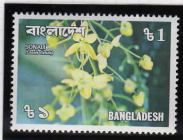
Pudding pipe tree