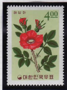
Sweetbrier スイートブライア (バラ)