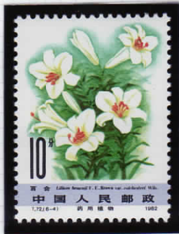
Lilium brownii 博多百合 (ハカタユリ)