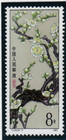
Green calyx 緑色の萼(ガク)