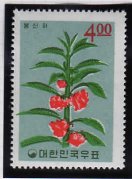
Garden Balsam 鳳仙花 (ホウセンカ)