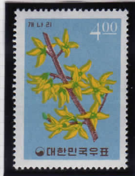
Forsythia 連翹 (レンギョウ)