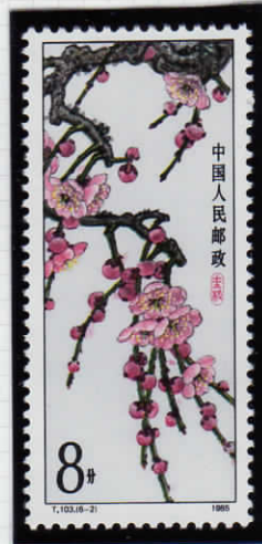
Pendant mei 枝垂れ梅