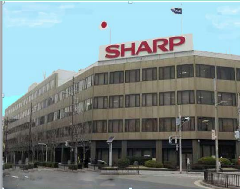
思い出のシャープ本社ビル