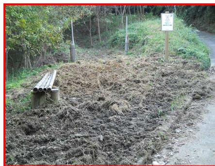
イノシシのヌタ場になった入口