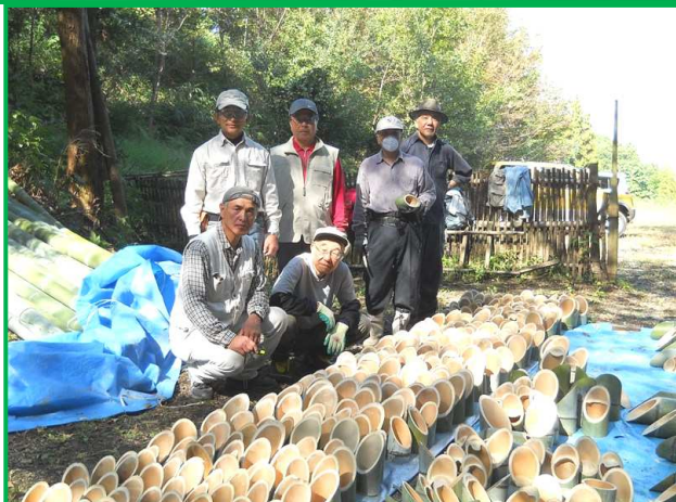
約300個出来た所で午前中の作業終了!