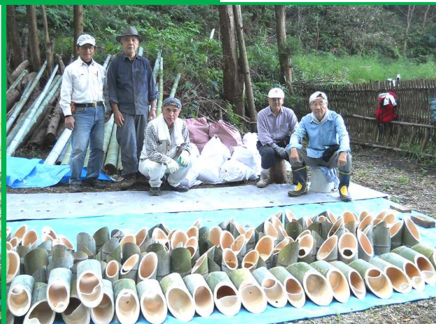
360個袋詰めして午後の作業終了!

その他報告。 年内に整備が必要な箇所が増えてきました。ぼちぼち本来の育林作業が必要です。