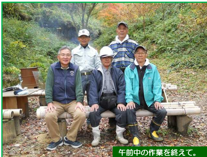
午前中の作業を終えて。