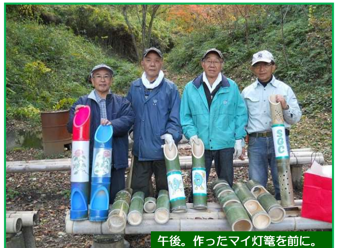
午後。作ったマイ灯笼を前に。