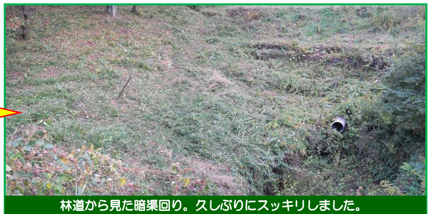
林道から見た暗渠回り。久しぶりにスッキリしました。