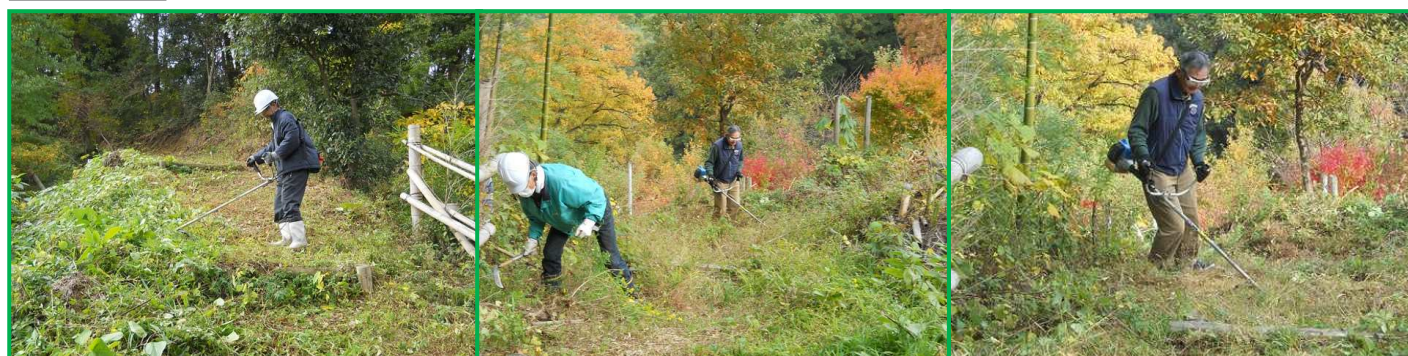
刈払機、鎌、チェーンソー総動員で作業しました。