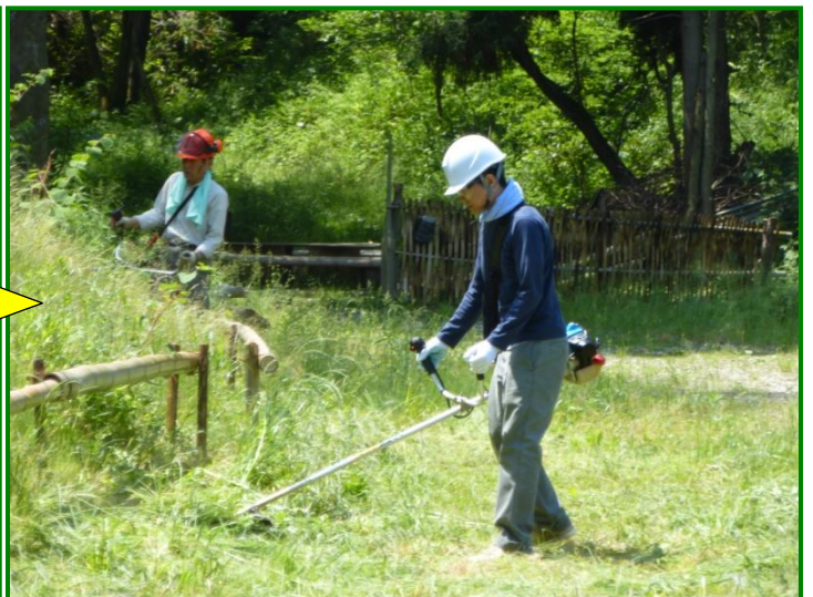
刈払機のエンジンが掛かりにくかったので、フィルター部を分解して清掃しました。長期間使用しないとこんな事もあります。