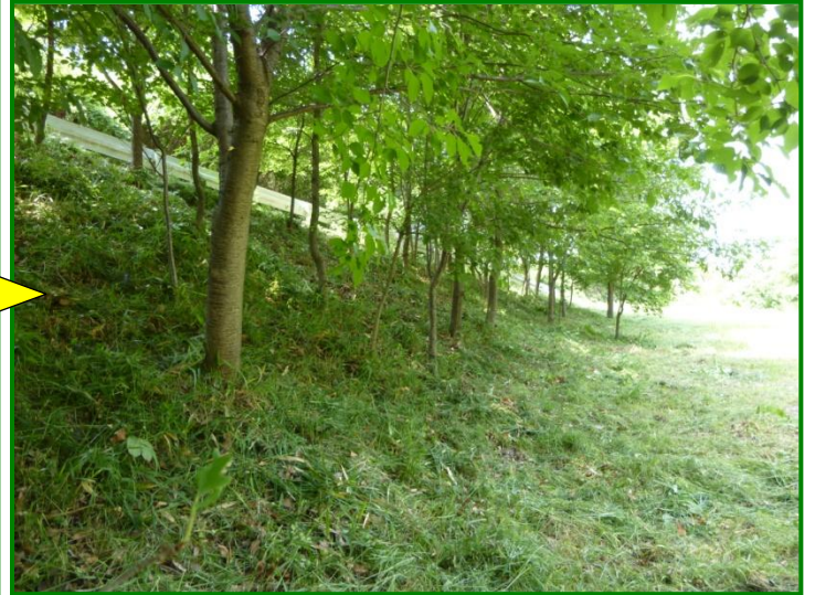
(左)雑草が伸びて向こう側を見通せなくなっていました。(右)雑草が無くなって奥のガードレールが見えるようになりました。