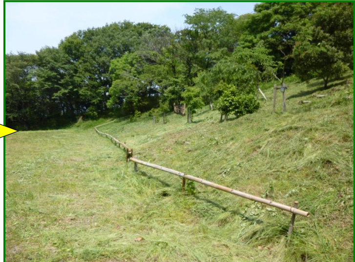
(左)記念樹ゾーン全体が草で覆われています。(右)雑草が刈り込まれて木や看板、バイクの侵入防止柵がよく見えます。