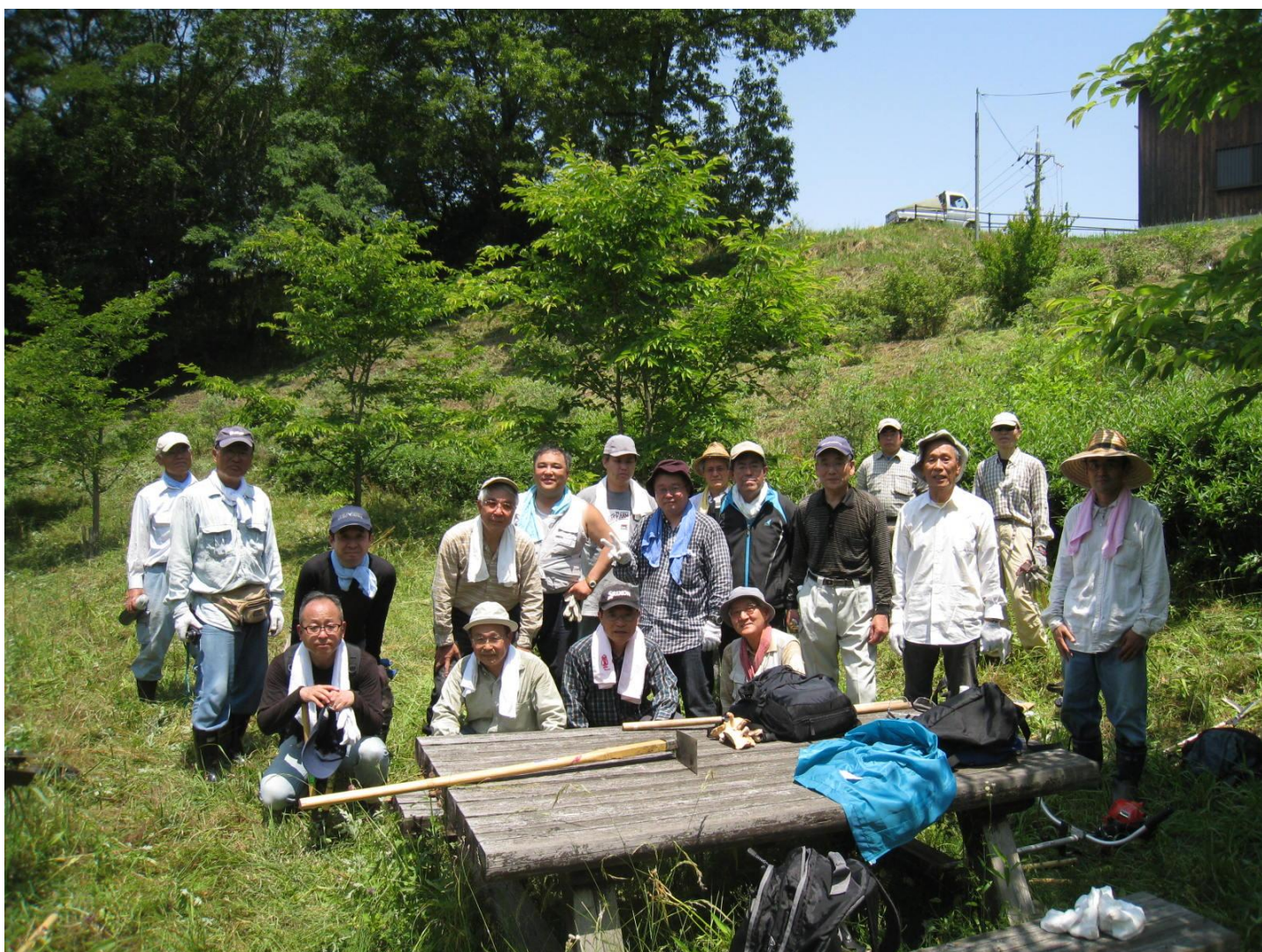
(2時間 汗を流し 5月のさわやかな薫風がこち良く感じました。)