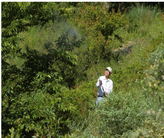
(ベテランOBの害虫駆除消毒。)