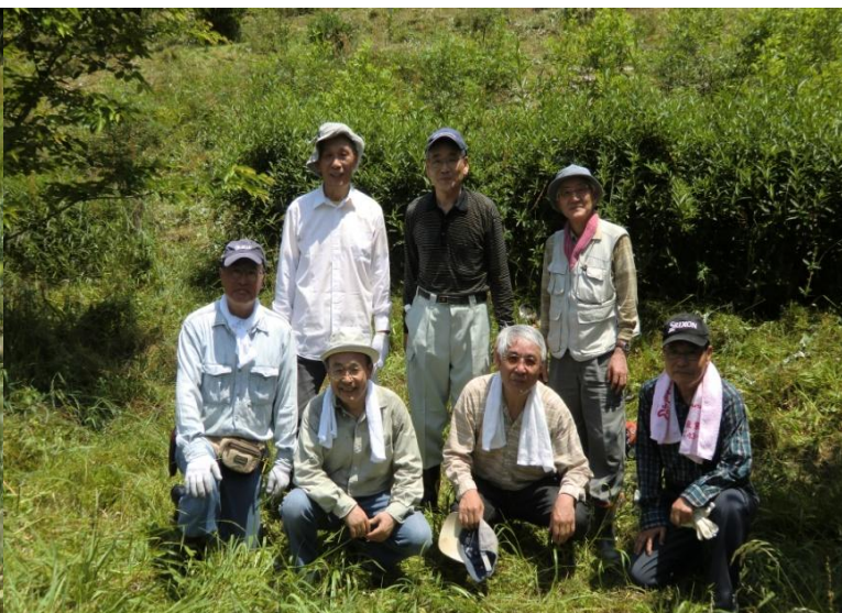
(社友会参加メンバー9名中7名。)