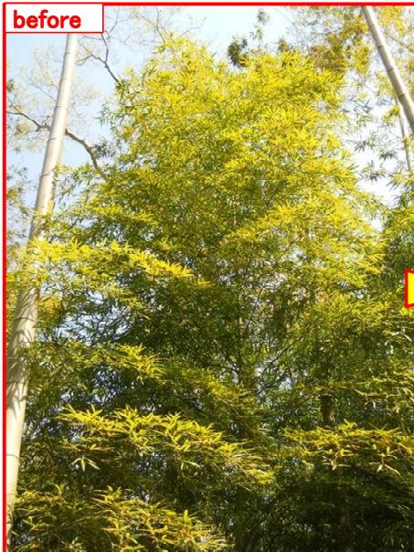
どこに木が有るのかわからない状態でした

自然木保全の為に竹の除伐。 急斜面で大変でしたが、ほぼ目的を達成。ターゲットの自然木の周りはスッキリ！