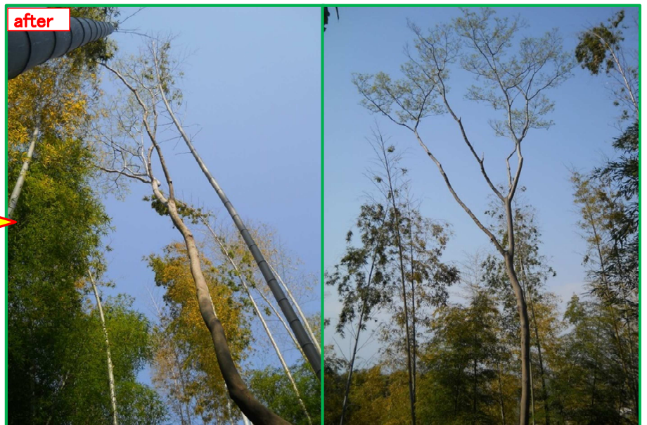
近くでは被さって見えますが・・・離れてみるとスッキリしたのが判ります。

◆作業風景 久し振りにヘルメット・ゴーグル着用の作業で、更に急斜面ですから足場の確保が大変でした。