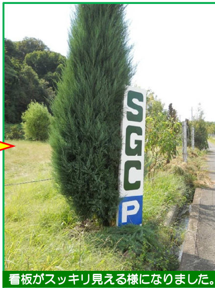
看板がスッキリ見える様になりました。