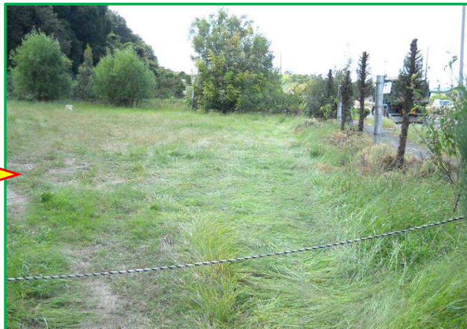
車で踏まれたくらいで参るような雑草ではありませんが、次回どうなっているか楽しみです。