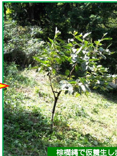
棕櫚縄で仮養生しました。