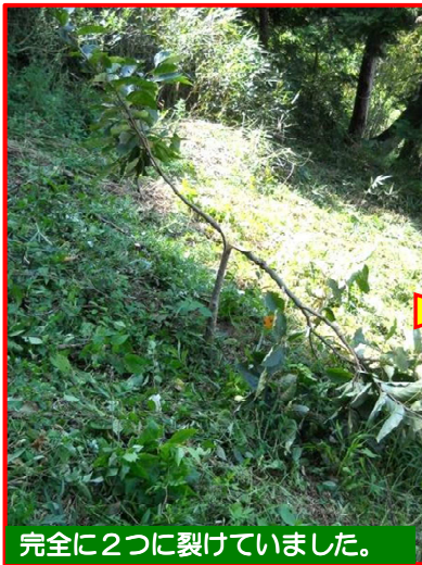
完全に2つに裂けていました。