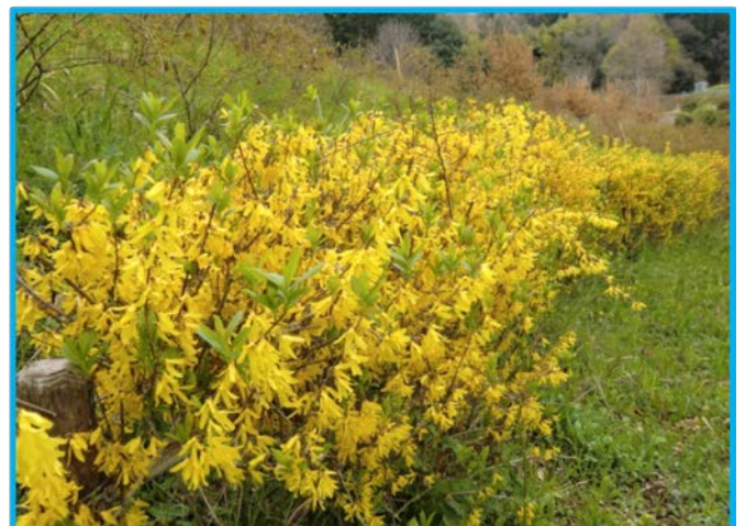
(レンギョウの垣根)