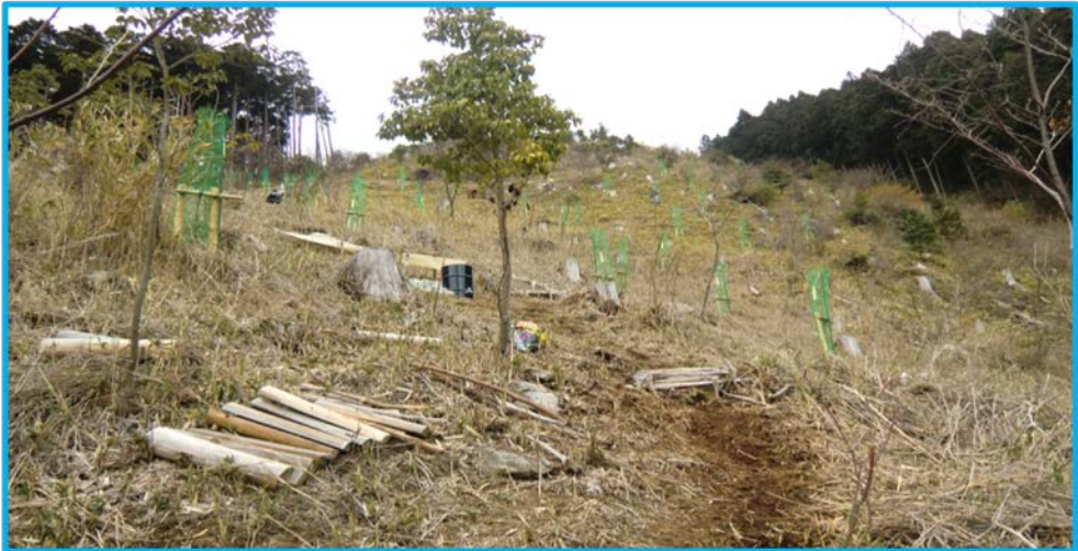
(観音寺から音羽山に登る途中、植え付けされていた桜の苗木)