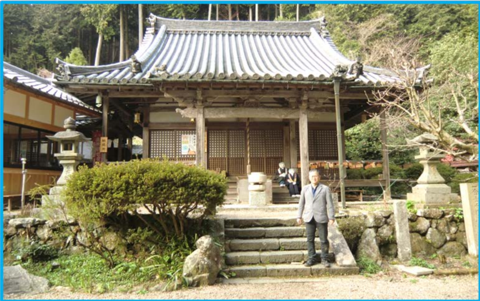
(音羽山の中腹に建つ観音寺 尼寺)