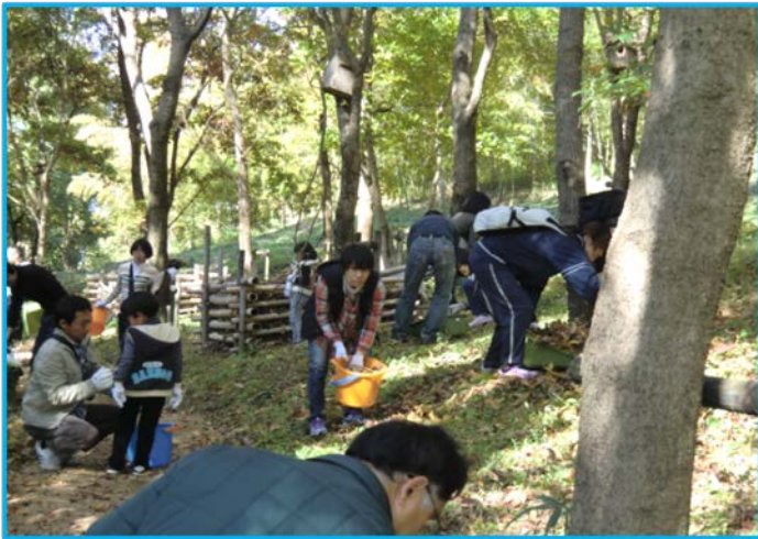
Bゾーン(雑木林) 落ち葉拾い