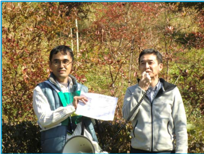
主催者・福田部長ご挨拶