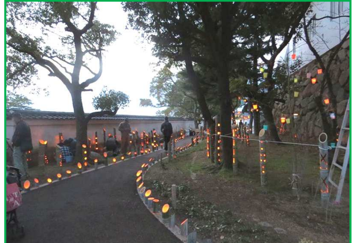
夕間詰め。点灯開始です。