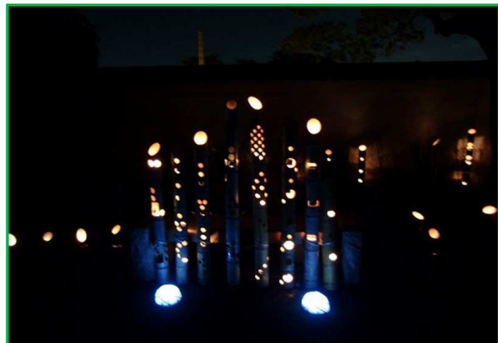
夜になると、幻想的な雰囲気が広がります。