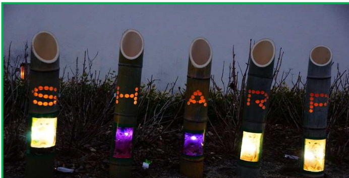
S・H・A・R・Pに点灯。LEDが明るく輝きました。