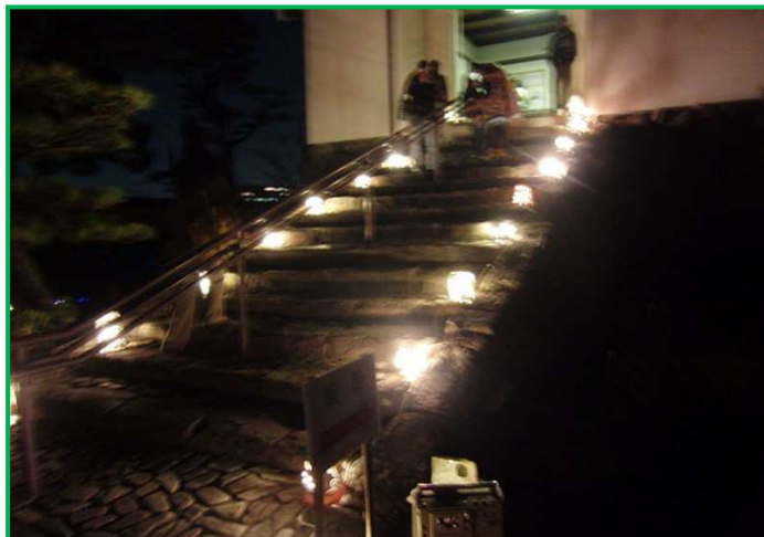
天守への石の階段も燈籠でライトアップ。

会場には、陶器、牛乳パック、紙袋、ガラス細工の瓶等竹以外の素材で作られた燈籠も多数出品されていましたが、竹燈籠は神於山の竹を使ったものだけで、出品も神於山保全くらぶとSGCの2団体のみでした。