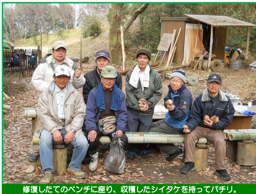
修復したてのベンチに座り、収穫したシイタケを持ってパチリ。