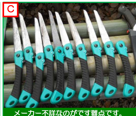
メーカー不詳なのがです難点です。