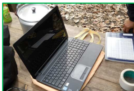
香遠さんのダイナブック。

・少し重いですが、大きいので見やすいのが良さそう。 ・次回のチーム神於山の活動日から観察の仕組みが組めそうです。