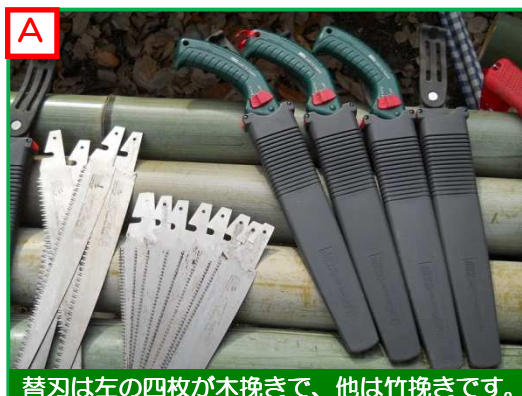
替刃は左の四枚が木挽きで、他は竹挽きです。