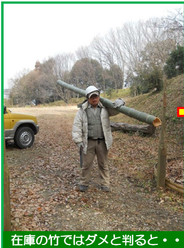
在庫の竹ではダメと判ると・・