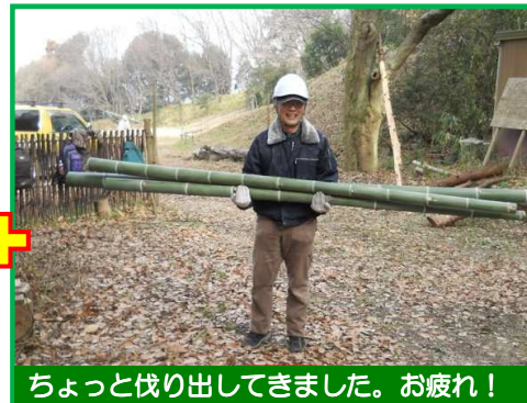
ちょっと伐り出してきました。お疲れ！