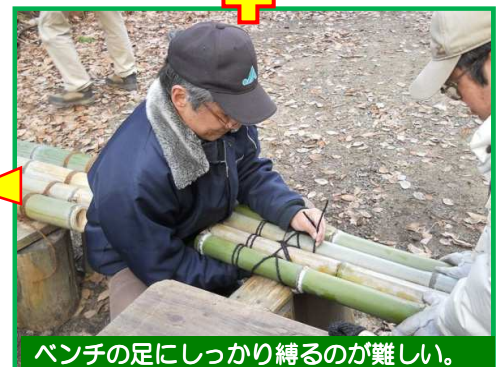
ベンチの足にしっかり縛るのが難しい。