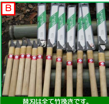
替刃は全て竹挽きです。