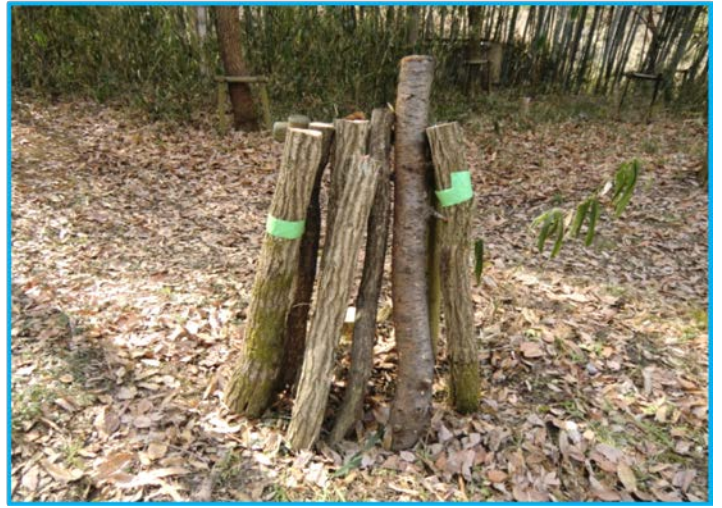
(シイタケホダ木用に作成 )