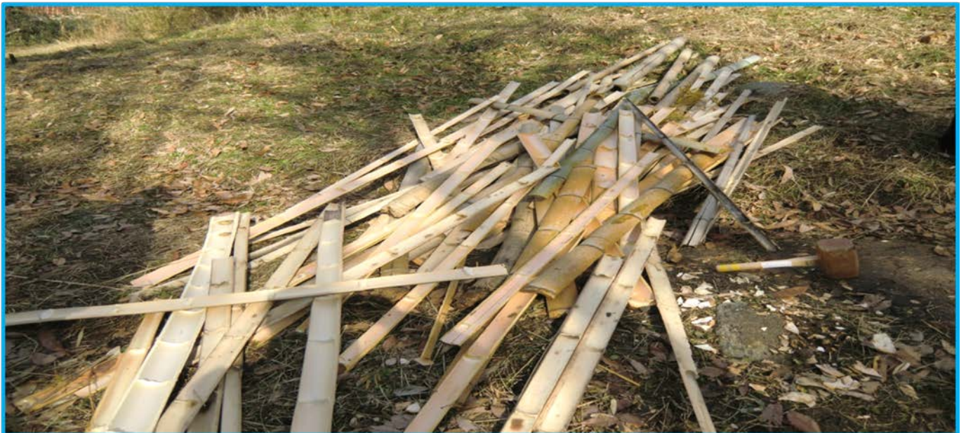
Cゾーン(竹林エリア)の新竹・旧竹を1,5m程度に切り揃え