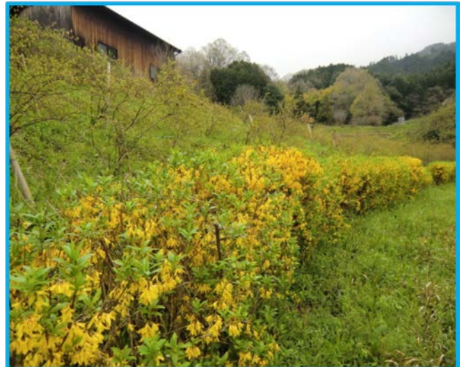
(生け垣レンギョウ)