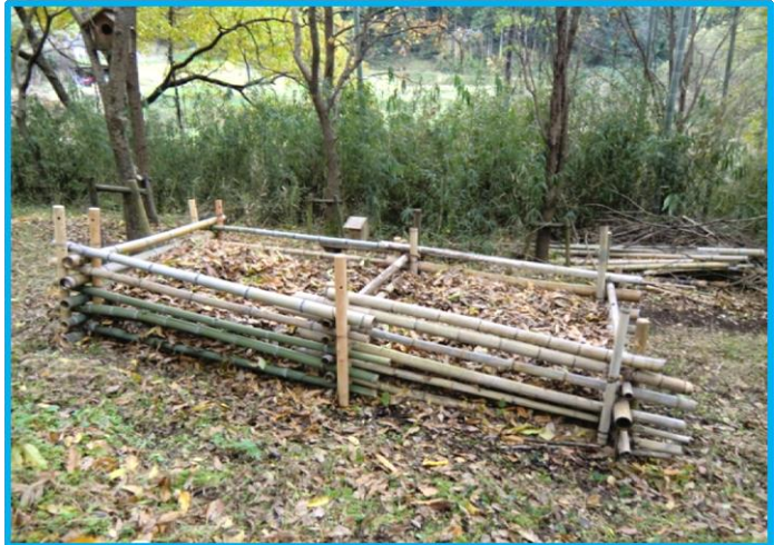
Aゾーン(果樹エリア) 下段の休憩場所の状況