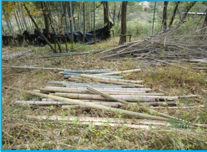
(竹林エリア) 伐採竹の整備作業