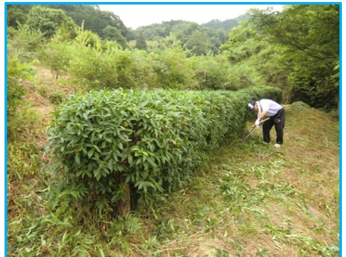
A ゾーン(果樹エリア)下段のレンギョウの生垣の剪定作業