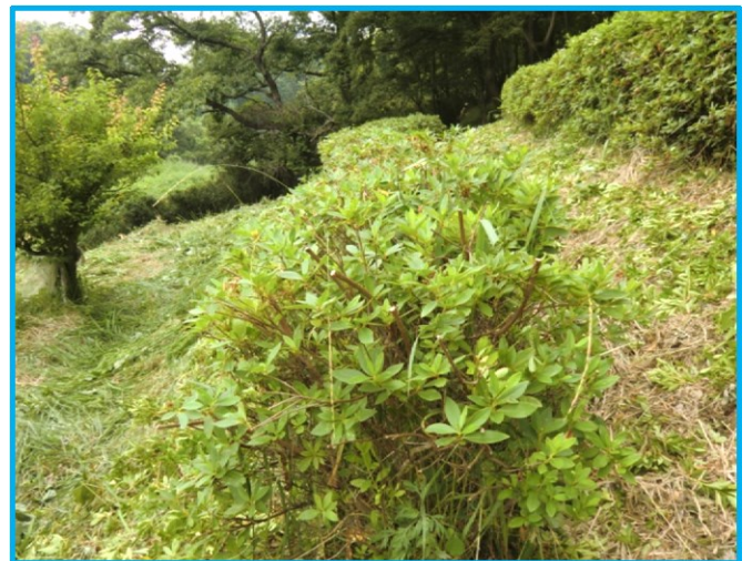
A ゾーン(果樹エリア)下段のヒラドツツジの生垣の剪定作業