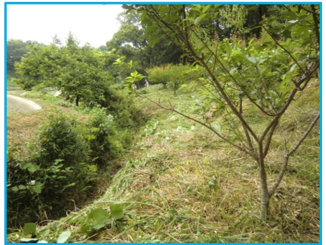
A ゾーン(果樹エリア)下段の梅の木 4本の回りの草刈り