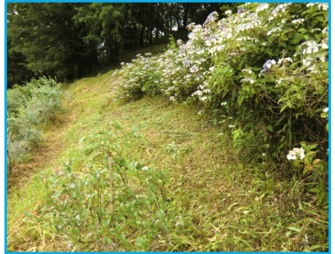
A ゾーン(果樹エリア)上段のアジサイの回りの草刈り作業