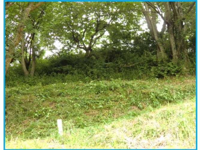
B ゾーン(森林エリア)の入口近くの草刈り作業