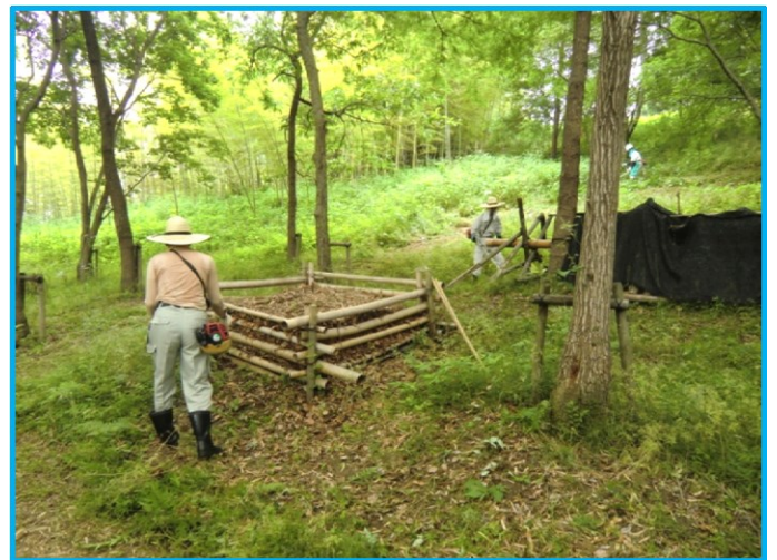
B ゾーン(森林エリア)の奥の草刈り作業