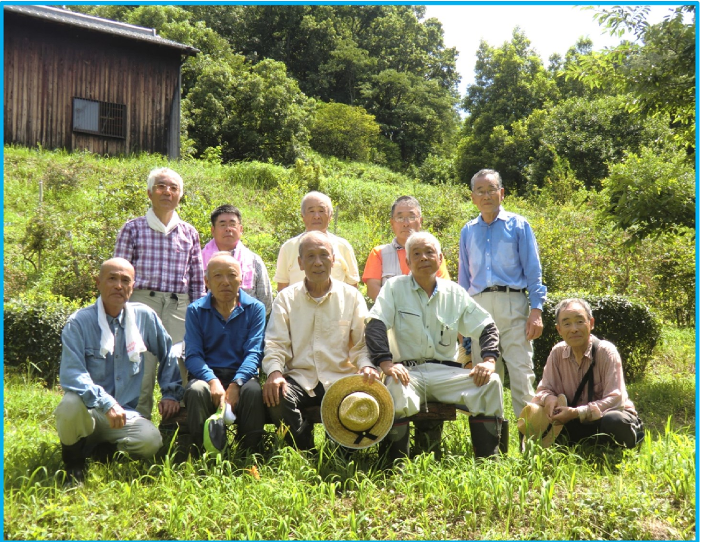
(ブルーベリー畑下の休憩所で撮影。)