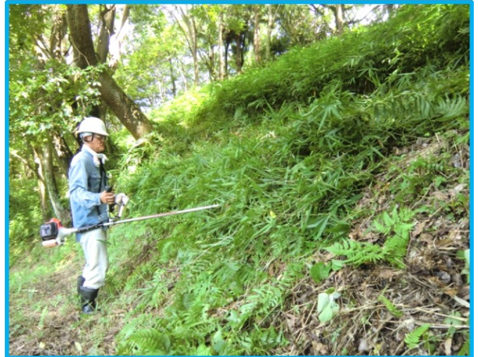
・ 森林エリア草刈り (社友会 GS・中井)