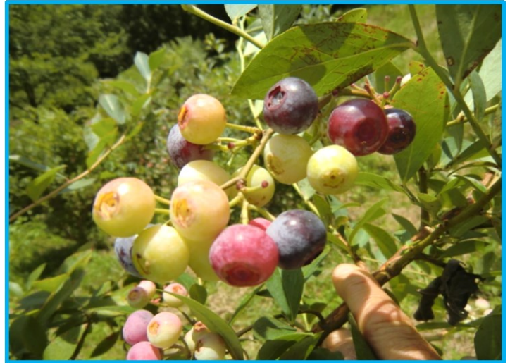
ブルーベリーの実の成長