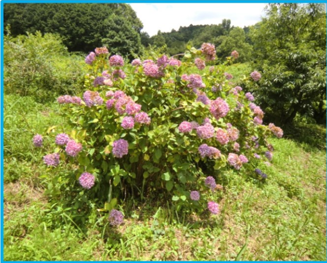
Aゾーン(果樹エリア)上段のアジサイの花