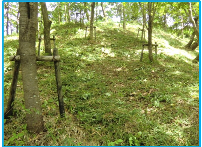
Bゾーン(森林エリア)傾斜の笹の草刈り作業