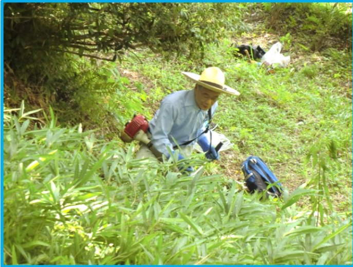
・ 森林エリアの草刈り (社友会 GS・西川さん)