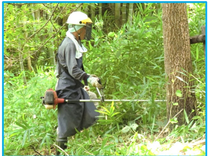
・ 竹林エリアの草刈り (友人・加茂さん)