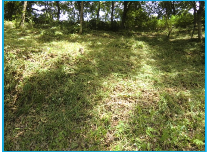
Bゾーン(森林エリア)傾斜の笹の草刈り作業