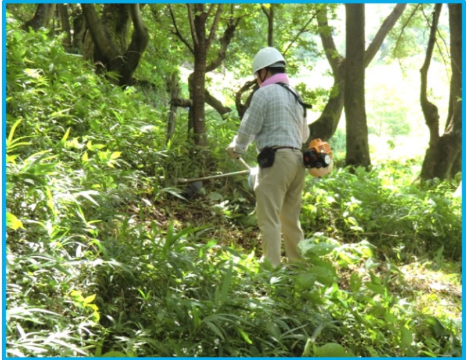
・ 森林エリアの草刈り (社友会 GS・田平さん)