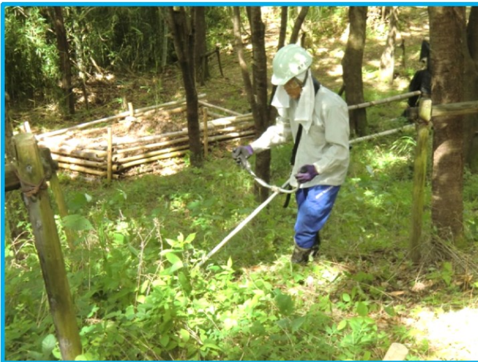
・ 竹林エリアの草刈り (友人・米谷さん)