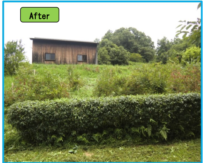
ブルーベリーの実は 4種類出来ていました