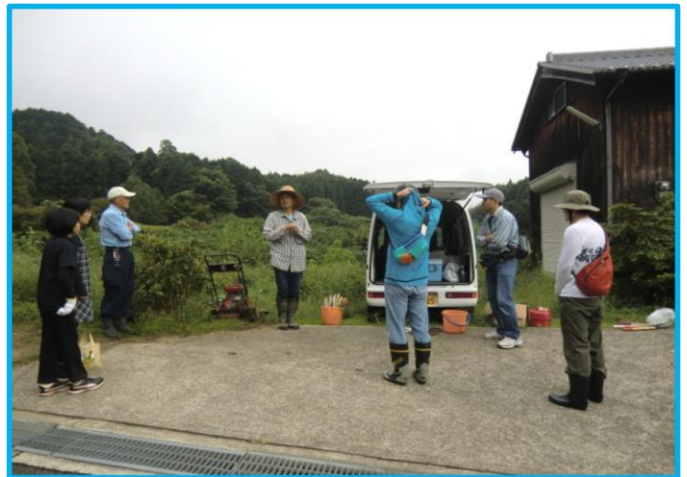
Cゾーン(竹林エリア)の大きな竹の伐採作業