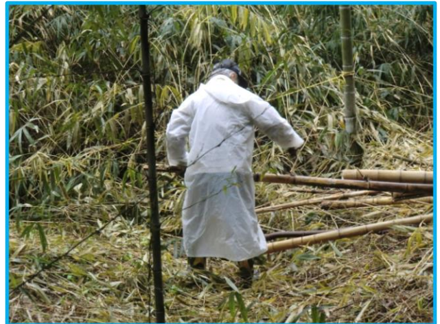
(シャープ OB・松山さん)