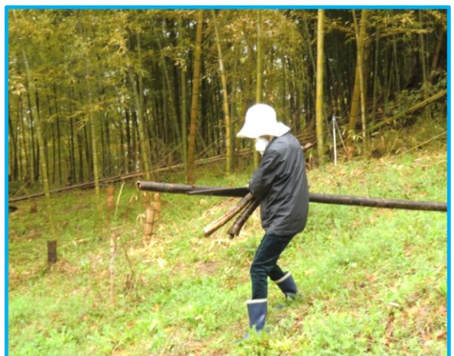
(廣本さんの奥さん)