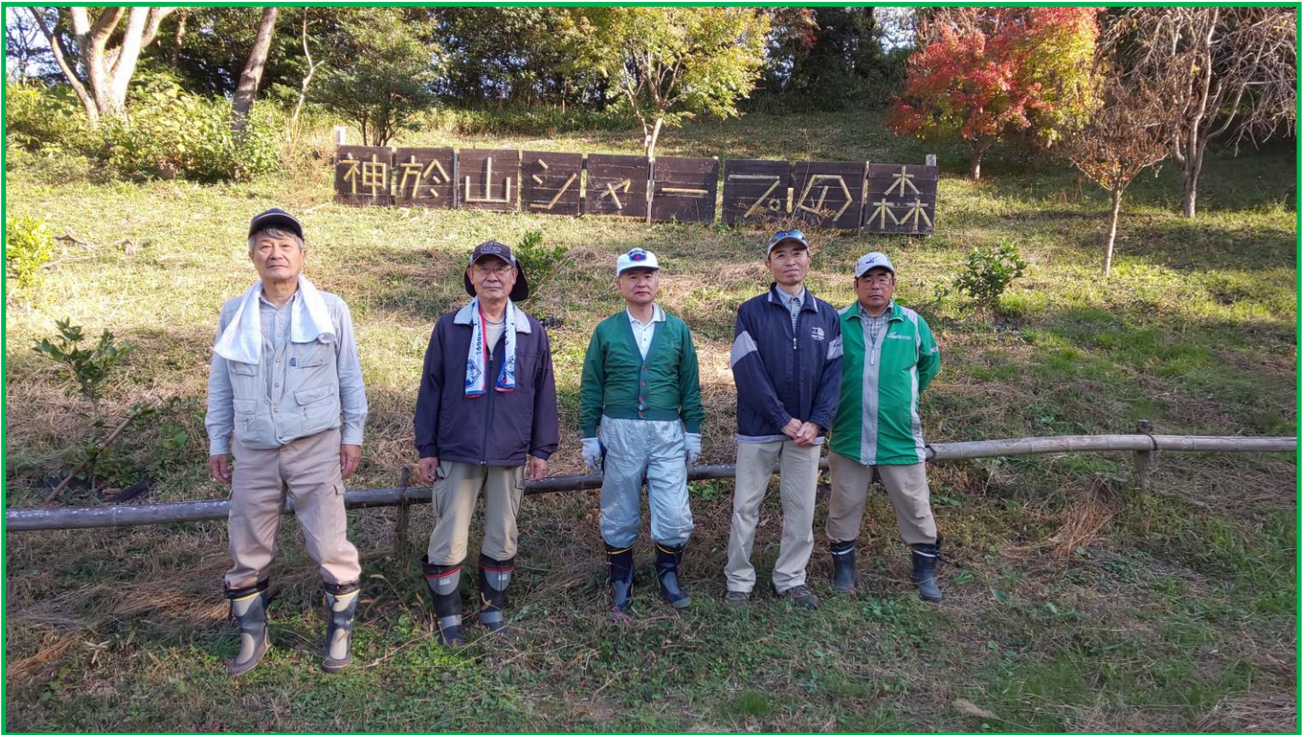
午前中で帰られた香遠さん、森さん写真がなくてすみません。