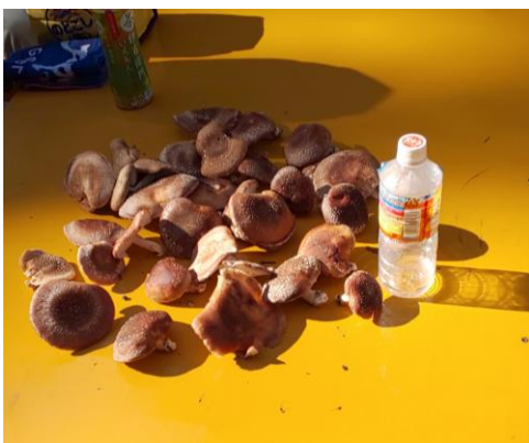
神於山の分厚くて美味しいシイタケがこんなに取れました。