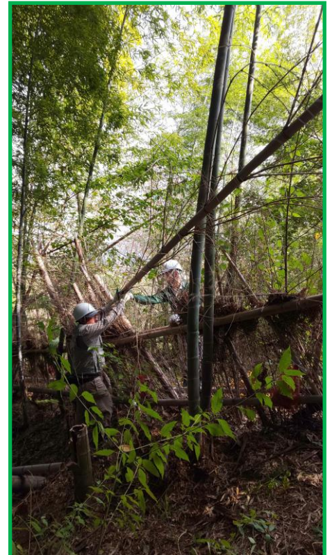
倒した竹は柵の外に運び出しました！