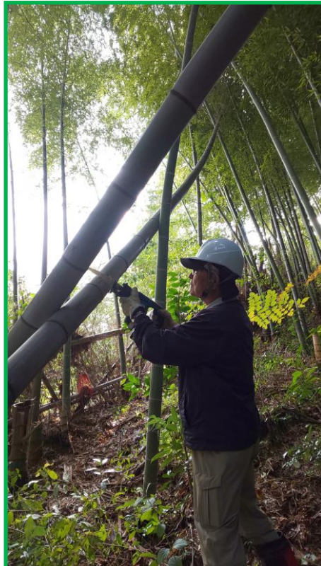
倒れた竹同士が交差しているため、根本だけでなく、いくつにも切断する事になりました。 電動のこぎりが大活躍です！