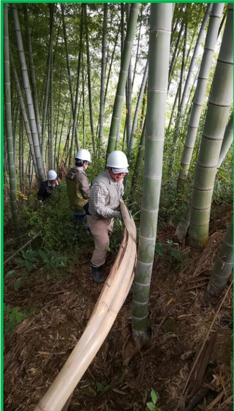
折れて曲がった竹は運ぶのも大変！

風ぐらいでは折れないと思っていた竹が、真ん中から割れて、ひしゃげて周りの竹に引っかかっていました