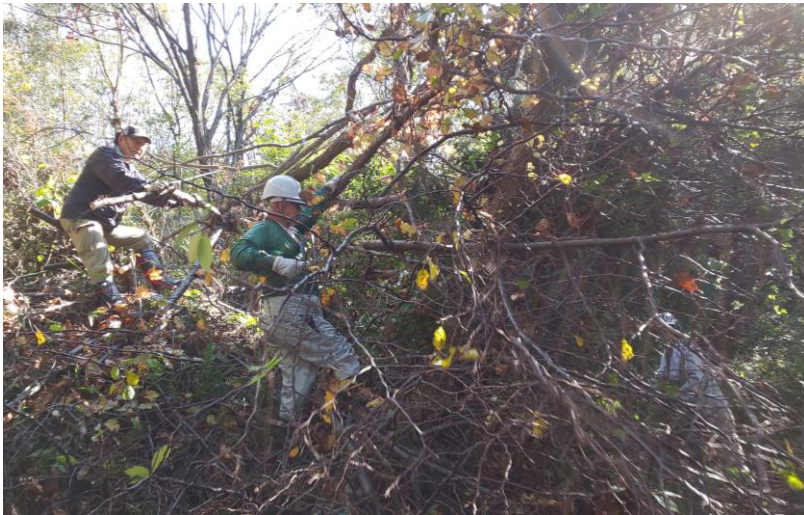
右下が道。上から覆いかぶさっています