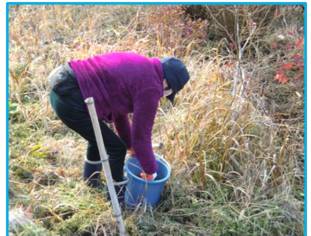
・肥料まき作業 (廣本の奥さん)