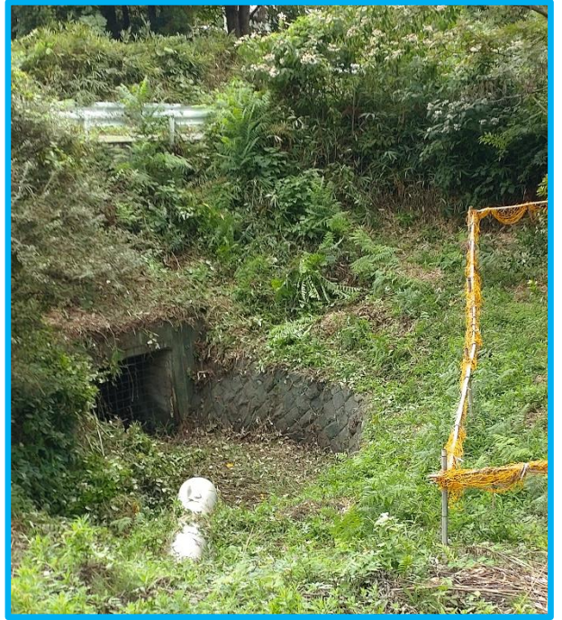
暗渠の底が久しぶりで姿を現しました