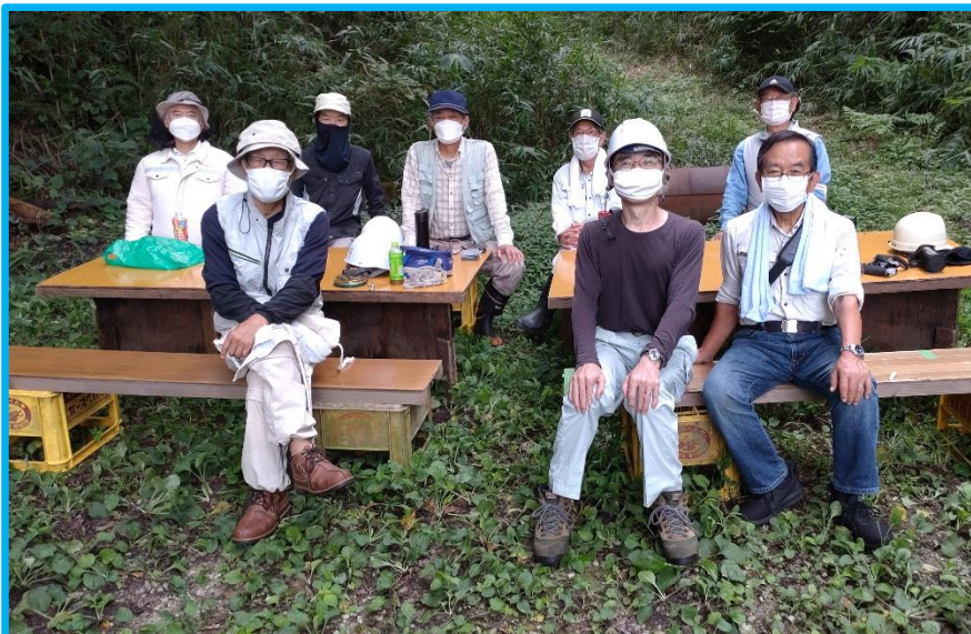
暑い中の活動、お疲れさまでした。