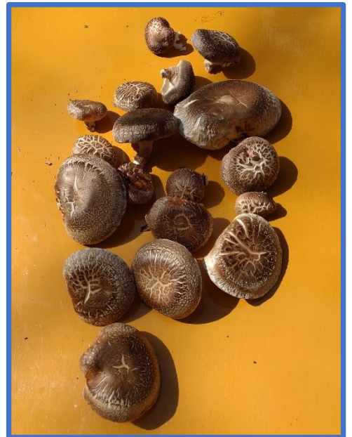
綺麗なシイタケが取れました。 次回の活動で、年末に間伐してあった木にシイタケの植菌を行います。