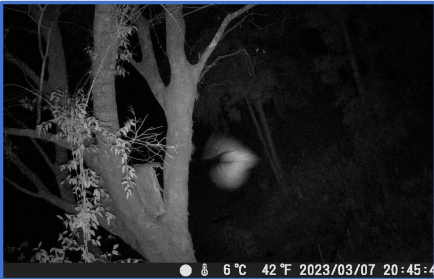
画面中央に巣箱方向に飛ぶ、フクロウと思われる鳥の姿（胴体と左右の翼をしながら飛んでいる白い姿）が写っています。