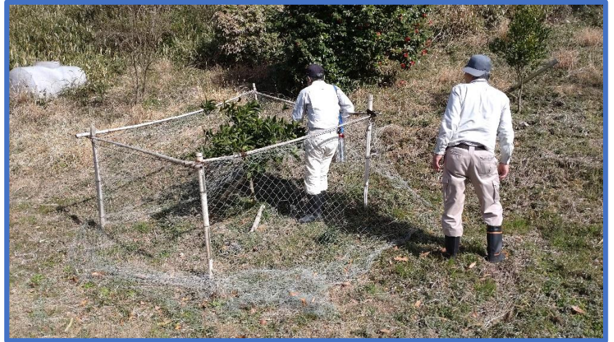
左・上) 果樹の消毒を行いました。すみません施肥の頃に私が巣箱確認に行ってしまう写真が撮れていません。