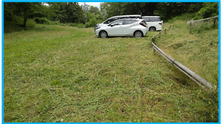
After 竹柵が奥まで続いているのが見えるようになりました。