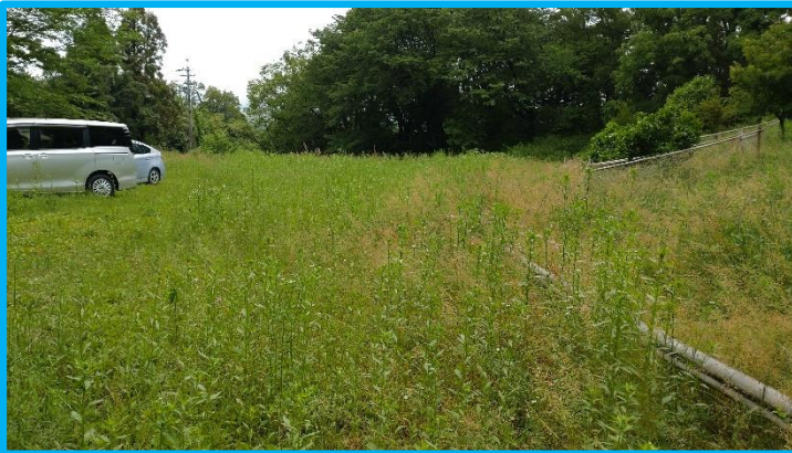
Before 画面右側の竹柵が、途中で草に隠れてしまいます。