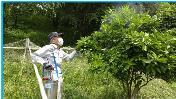
果樹に薬剤散布するのに、上を向いて散布しています。いつの間にか、果樹がこんなに大きくなっていました。