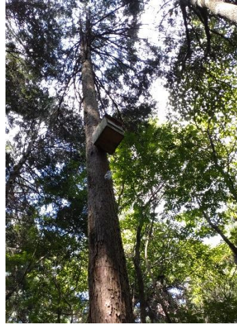
左：この季節も一応フクロウの巣箱も点検します。 右：ムササビの巣箱を見上げると、この高さです。