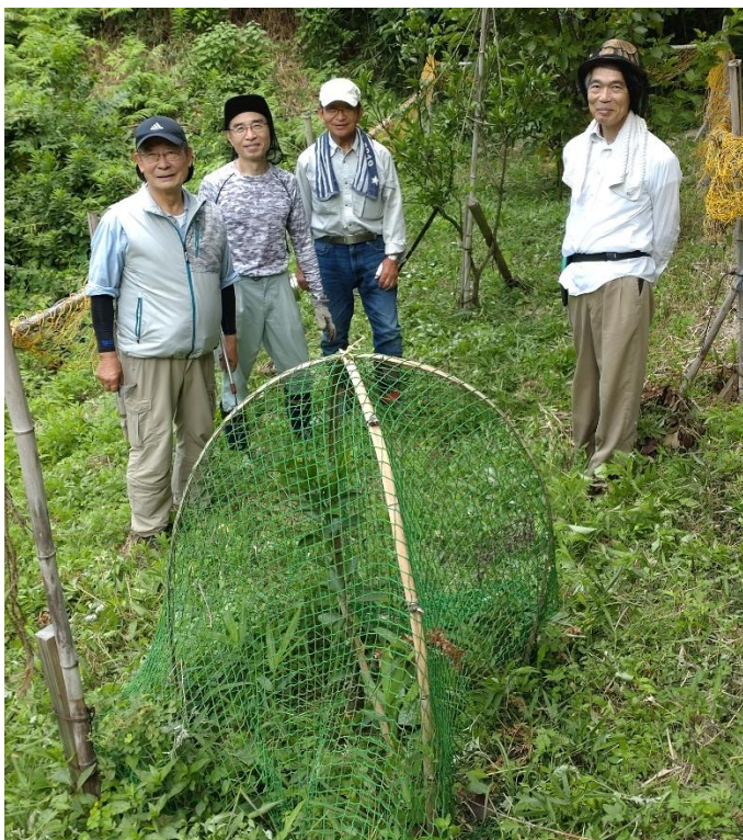
草刈りをした暗渠側の苗木の前で撮影しました。 皆さん、何かと忙しいなか参加頂きありがとうございました。 活動お疲れさまでした。