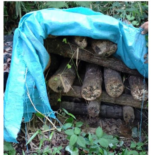
今年植菌したシイタケの楯木。 シッカリ菌が回っています。 次回本伏します。