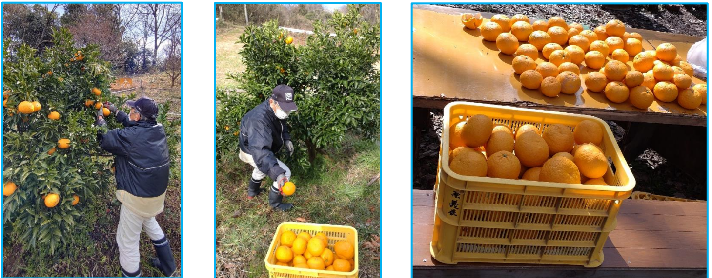
この木一本で100個以上収穫出来ました。この実もしばらく寝かせてから食べた方が良さそうです。この日の参加者で半分ぐらい持ち帰りましたが、まだ倉庫に残っていますので次回参加者もお楽しみに。