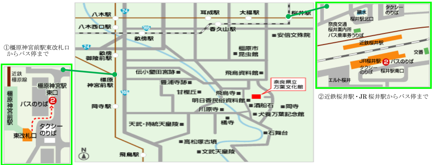
① 橿原神宮前駅東改札口からバス停まで