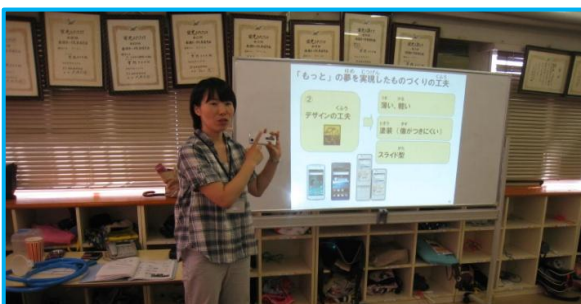
鈴木先生と サポートメンバー