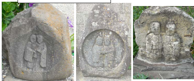
塩尻宿の双体道祖神