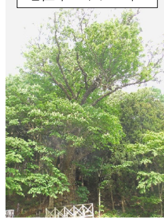
老巨木のトチの木

宿場の外れに大きなトチの木があり、樹齢千年以上、高さは32m、根元周囲10m以上で長野県天然記念物になっている。江戸時代初期には既に大木として記録に残っているとのこと。