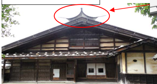
堀内家、江戸時代中期