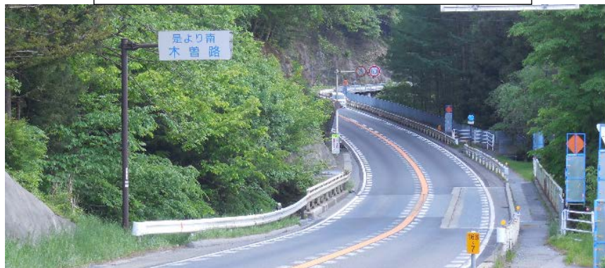
木曽路の交通標識、右側の歩道が旧中山道

そのアオキも今は何代目の子孫で小さい木。 日出塩の地名の由来が知りたくてネットで調べた。 太平洋と日本海からの両方の塩の道の終点が塩尻、しかし日出塩はわからなかった。