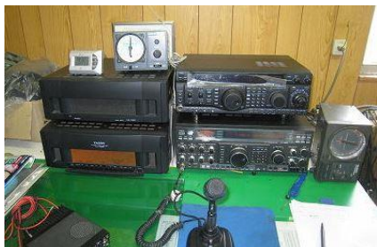
過去の交流会（野呂山無線室）