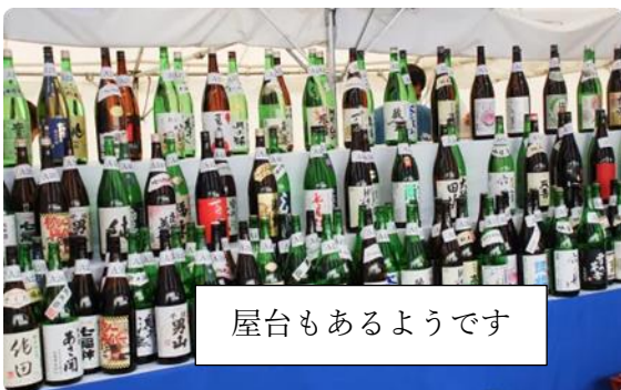
屋台もあるようです