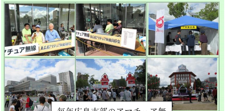
毎年広島支部のアマチュア無線の運用もある