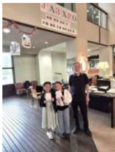
写真: 万博特別記念局 JA3XPO を JA3YHU で運用

また、55 年ぶりに復活した万博特別記念局 JA3XPO を JA3YHU で運用し、体験運用制度[4]を利用して子供さんらにアマチュア無線の楽しさを伝える活動を行いました。子供さんらの満面の笑顔が強く心に焼き付きました。