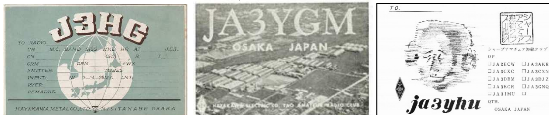
写真: J3HG、JA3YGM、JA3YHU の QSL カードと、JA3YHU の 1981 年当時の免許状

HAYAKAWA METAL CO. LTD. NISHITANABE OSAKA とある J3HG の QSL カード。中央には当時の T を握るロゴも入っている。JA3YHU のカードには発足メンバーのコールサインも見える。