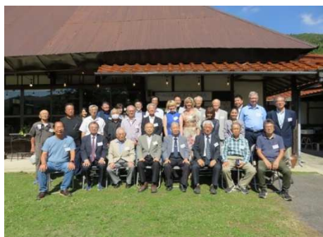
写真: 広島交流会(左)、FM 大阪見学会(右)

また秋には、年一度開催している広島地区との定期交流会を開催し、同時に、教育・研究価値が高い「ラジオ博物館 東広島」の設立開所式を行いました。40 名近いメンバーと、多くの地域住民の方が集まりました。FM 大阪の放送設備の見学も行いました。