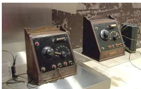
写真: 国産第一号鉱石ラジオ(左)と記念展で製作したレプリカ(右)、FB ニュースにも掲載