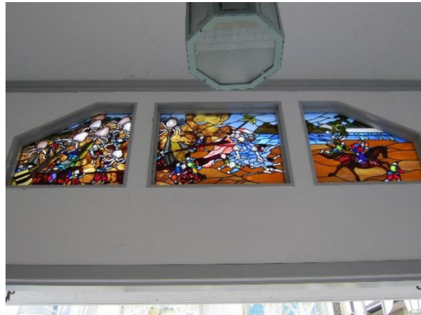
蛸地蔵駅 駅舎とステンドグラス

蛸地蔵駅から少し歩いて「蛸地蔵」という変わった名称の由来が分かるというお寺を訪ねました。