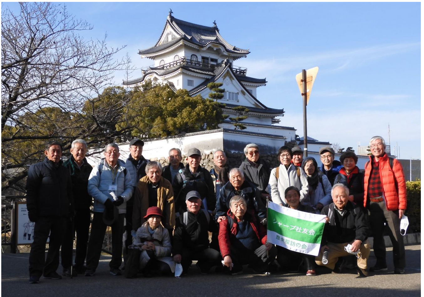
岸和田城を背景にして