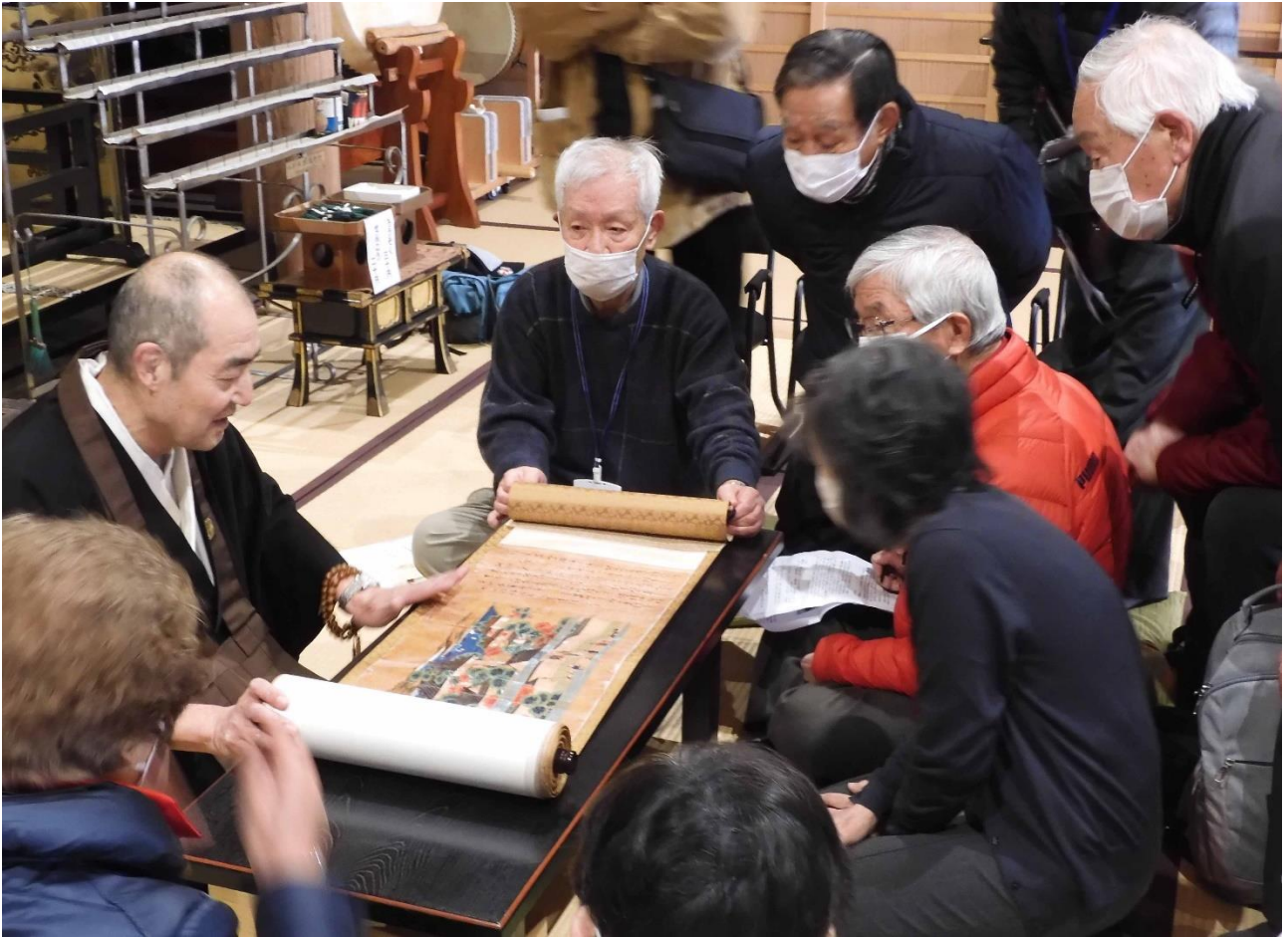
天性寺のご住職より絵巻物の解説をしていただきました