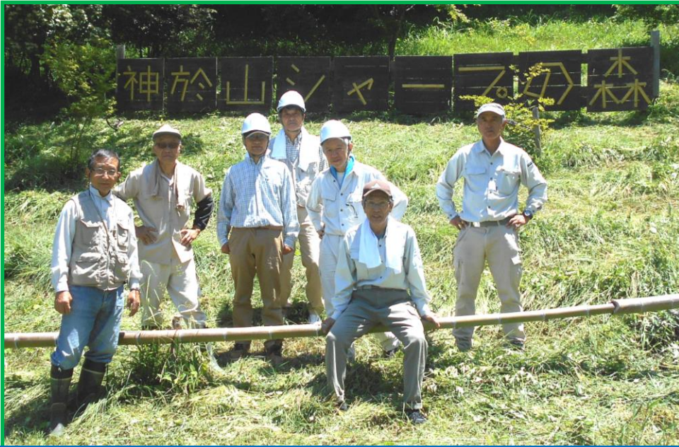
午前中活動頂いた皆さん。ご苦労様でした。