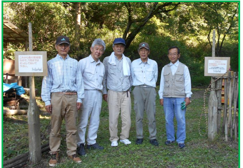
午後も活動頂いた皆さん。お疲れ様でした。