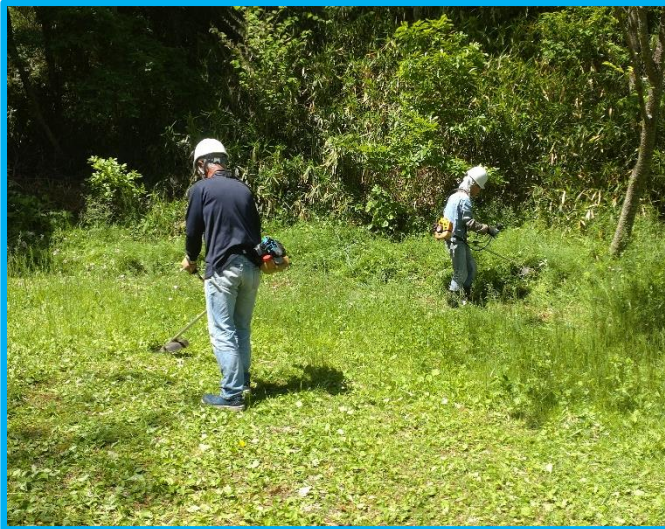
前回活動で雨が降り出して刈り残した広場の草を、今回活動で綺麗にしました。