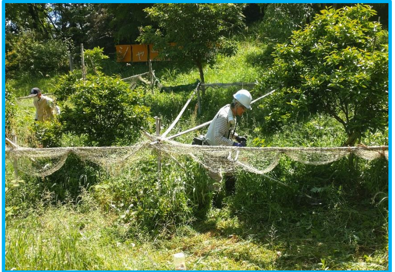
果樹柵の中も刈払い機で草刈りをしました。草丈は腰ぐらいまでありました。