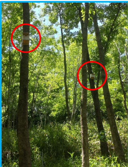
木製巣箱は、林道から植栽地に入る進入路に沿った木に掛けました。（赤丸内）