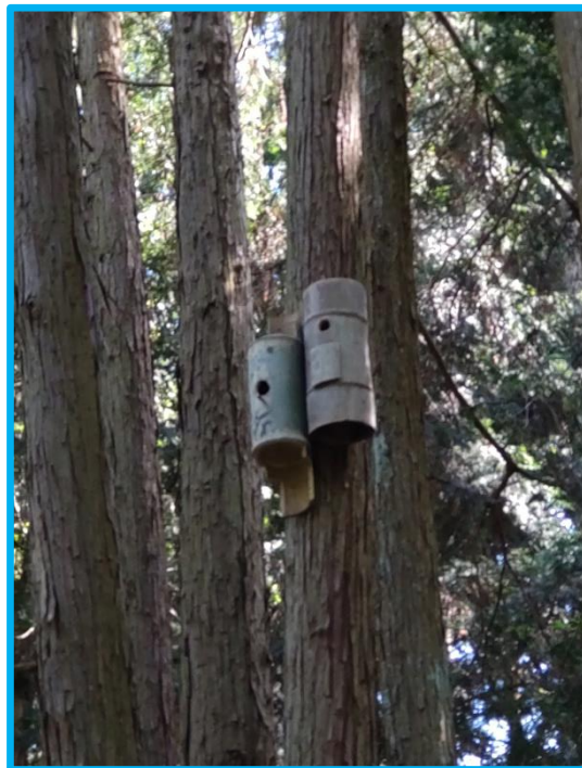
竹巣箱は、以前フクロウの巣箱を架けていた木に掛けました。竹巣箱はさらに増やして、巣箱で団地の様に見ようと思っています。