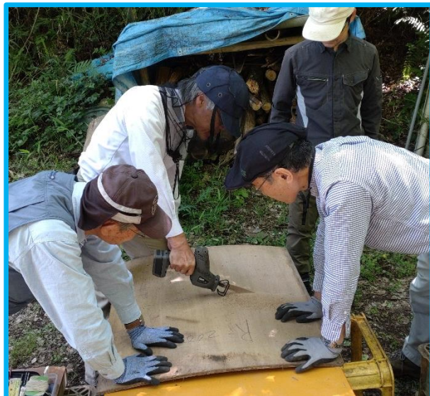
脚部の基部になる板を半分に切ります。この板が曲者でした。湾曲していて、傷んでいて、左右で長さが違って、どの角も直角ではありませんでした。