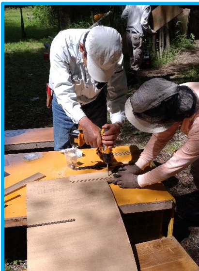
脚部の基部の中心に、交差して差し込むための切り込みを入れ、足を取り付けました。板の歪みの影響でワンペアのつもりで作った脚の高さが5mm程違ってしまいました。次回活動でもうワンペア作るので調整の予定。