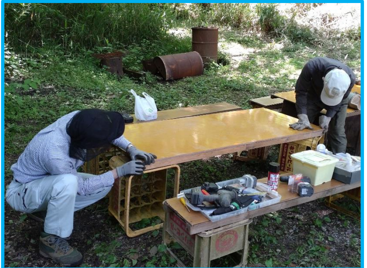
両側を切り落として細長い机になりましたが、当て木が効いてタワミが無くなりました。