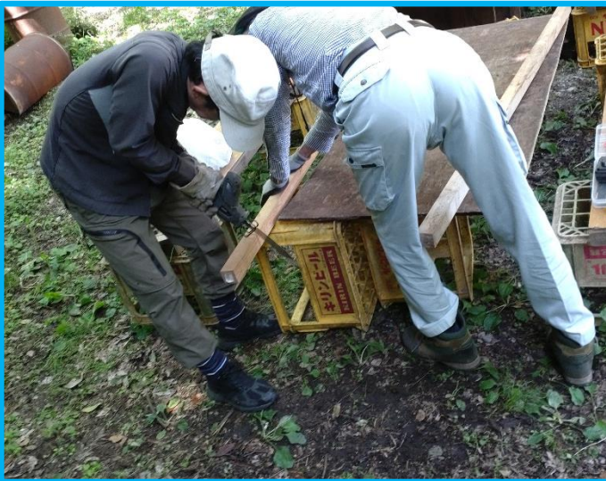
傷んでしまった天板の両側を10cm程切り落とし、当て木を新しくしました。