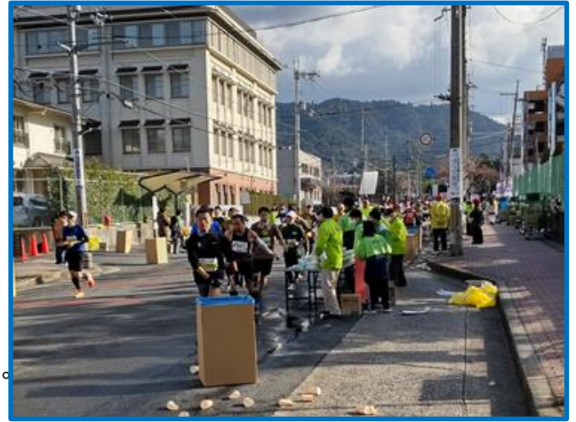
社友会はランナーから見て左側の水のテーブル1から3を担当しました。 コップに水を入れ、3段、4段積み準備してランナーをむかえました。