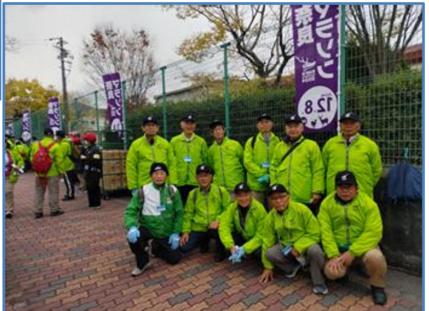
参加11名の記念写真 活動前の集合写真です。