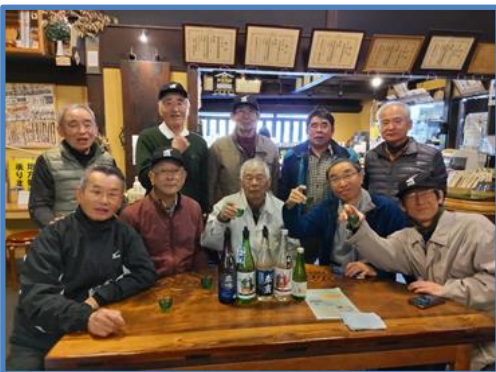
恒例の春鹿酒造で5種類のお酒の利き酒をして東向き通りの 一条での昼食をみんなで楽しみました。