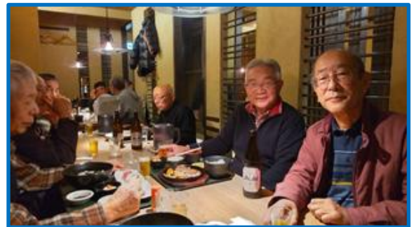
恒例の春鹿酒造で5種類のお酒の利き酒をして東向き通りの一条での昼食をみんなで楽しみました。