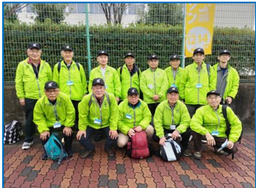
参加13名の記念写真 活動後の集合写真です。