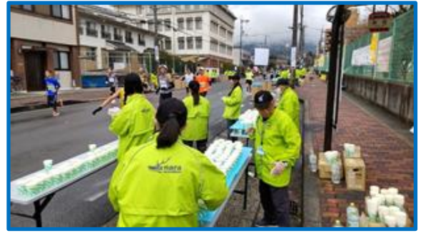
社友会はランナーから見て左側の水のテーブル1から4を担当しました。 コップに水を入れ、3段、4段積み準備してランナーをむかえました。